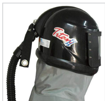
Capacete com sinalizador de pressão mínima e avental

Conjunto de proteção para jatista composto por: